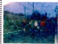
ハツ手元日マラソン

施封2011・11・27、開封2020・11・11「百日の夢のタイムカプセル」が埋められています。