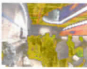
リニア見学センター

時速500kmの世界を体験できる山梨県立リニア見学センターを見学し、ハーベキュー