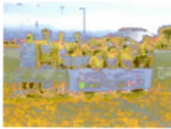
市民駅伝手良チーム

第35回市民駅伝「イチヤクン駅伝カーニバル2017」は秋晴れの10月9日伊那市陸上競技場を中心に行われました。 手良チームは地区民の声援を受けてクリーンのユニホームで頑張った。地区子ども部は参加1チームの中で1位、地区の部では参加8チームのうち7位、総合では5位となりました。