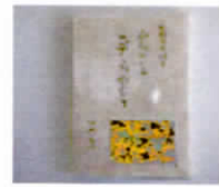
ふるさと薬草ものがたり