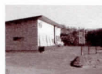
デーサービスめくもり

伊那市では高齢者のみなさんが住み慣れた地域で安心してその人らしい生活を続けられるよう、健康・福祉・介護など生活の中の困りごとを相談し、支援につなげるための総合相談窓口を設けています。 市内7ヶ所の地域密着型ケアセンター作成・配布、伊那市・南箕輪村へ社会福祉用品の寄付などです。 手良の会員は増員45名です。