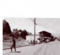
イナちゃんウォーク

伊那市・市教育委員会などの主催による「イナちゃんウォーク」は5月21日午前9時を会場に5月21日午前9時30分スタートで行われ約350人が参加し賑わいました。手良小学校が協賛で「イナちゃんウォーク」の「西側」コースでは3チーム、「仙丈ヶ岳」コースでは2チームが参加し4人以上のチームで中央アスファルトや仙丈ヶ岳を通過しながら汗を流しました。