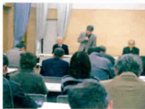
活性化促進会議総会

「若い人たちのエネルギーを頼もしく感じる」などといふことがありました。28年度の事業では親子ふれあいトンカチ教室、狼煙上げ、第7回てらとびコン、活性化だよりの発行などが報告されました。