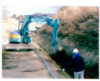
農業用排水路改修工事

農業用排水路などの改修工 事が農閑期の3月までに行われ ています。国の農村漁村活性化プ ロジェクト支援交付金事業で 請負業者は西武建設(株) 当初予算は1億5千万円です が本年度は2800万円の予算 が付き八手くさくさ地区は今年で 終わります。現在中坪地籍で工事を 進めています。