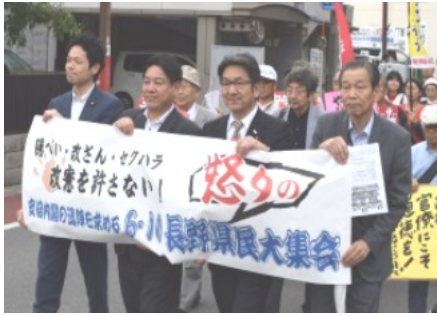
4野党代表が揃ってのデモ行進