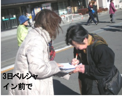
3日ベルシャイン前で

投票者の過半数に「憲法9条改憲NO!」の署名を、との目標を4月末までに突破しようと、9条の会や共産党伊那市委員会、民主