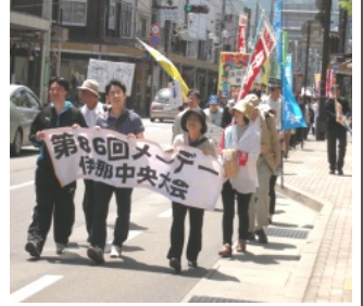
5月1日、伊那文化会館での集会後、市中を行進する約200人の参加者