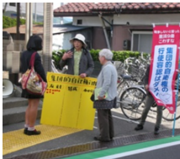
新婦人伊那支部の沢渡駅でのシール行動。熱心に話を聞く女子高生

5月22日の集団的自衛権行使容認についてのシール投票の結果は、反対39、賛成1、わからない2でした。