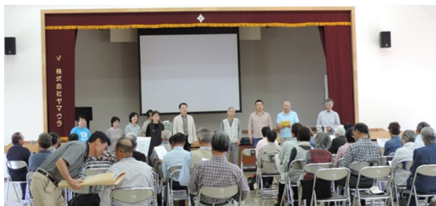
「憲法9条」を歌う「ざざむし」のみなさん

参加者からは「憲法に関心のない人もいるけれど、こういう事が今こそ必要だと感じた」との声が寄せられ、今後の活動の糧となりました。