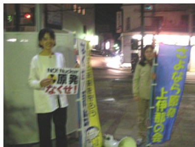
9月19日6時からいななっせ北側広場での行動。たとえ女性二人の時でも休まず続けています