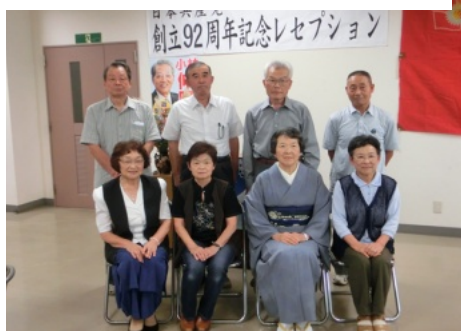
党歴50年表彰を受けたみなさん

上伊那地区の党創立92周年記念レセプションが、9月6日駒ヶ根市内で50名の参加で行われました。50年党員証伝達式の後、参加した8名の50年党員から今までの生きざまが語られました。