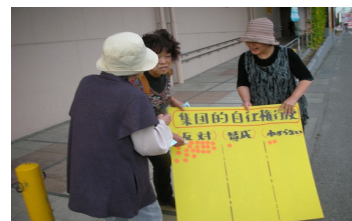
9月18日アピタ店前で